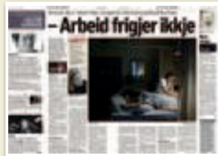
Klassekampen 18. januar

beidet i heimen og hennar karrieretap, seier ho.