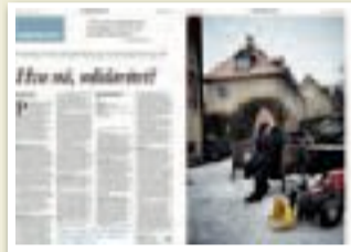
Klassekampen 19. januar

■ Fokuset på arbeid har vore for ein-sidig, seier delar av norsk kvinnerørsløse i dag.