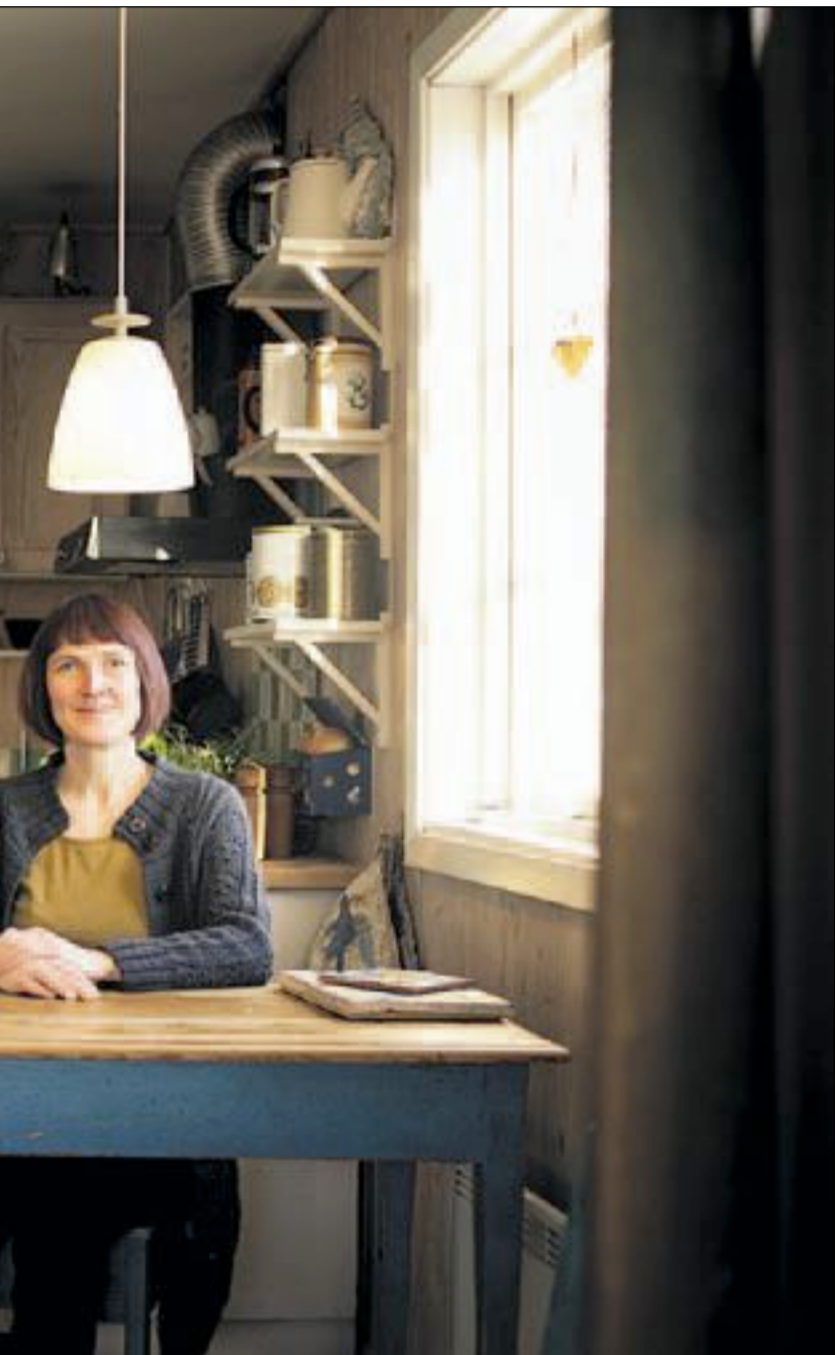
log og nestleiar i Norsk Kvinnesaksforening.

fått så veldig støtte, og då kanskje særleg i Arbeiderpartiet. Folk flest syns jo kanskje det er herleg å arbeida kortare dagar, sjølv om det fører til lågare inntekt.